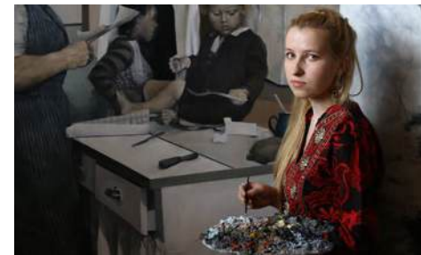
Bierunianka u progu wielkiej kariery.