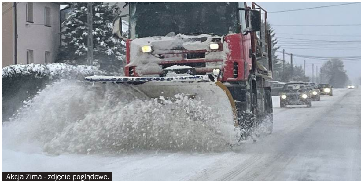
Akcja Zima - zdjęcie poglądowe.

ka, Bogusławskiego, Bojszowska, Chemików, Krakowska, Łędzińska, Remizowa, Kosynierów, Ofiar Oświęcimskich, Patriotów, Bohaterów Westerplatte, Mielęckiego, Lokalna.