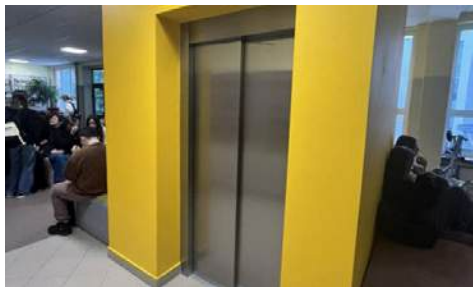
Szkoła bez barier.