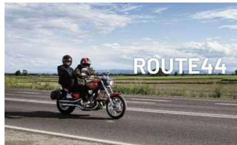
Niezwykły projekt „Route 44”.