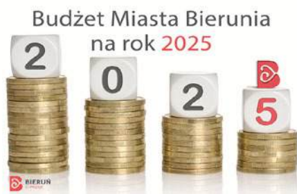
Budżet ambitny, ale realny.