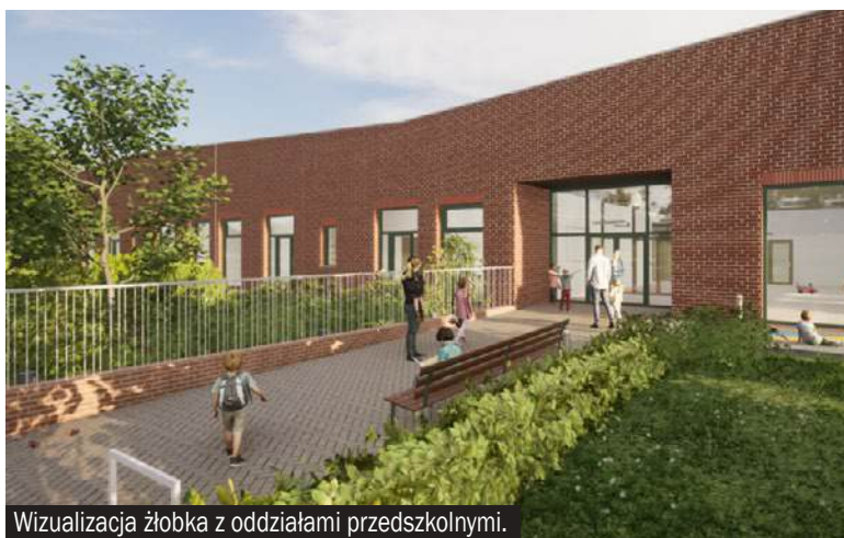
Wizualizacja żłobka z oddziałami przedszkolnymi.