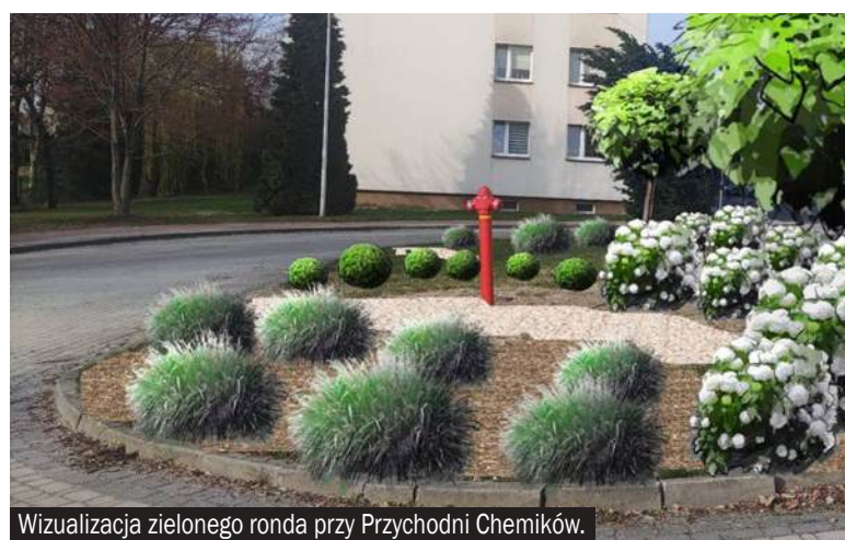
Wizualizacja zielonego ronda przy Przychodni Chemików.