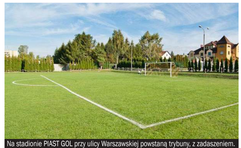
Na stadionie PIAST GOL przy ulicy Warszawskiej powstaną trybuny, z zadaniem.