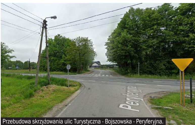
Przebudowa skrzyżowania ulic Turystyczna - Bojszowska - Peryferijna.