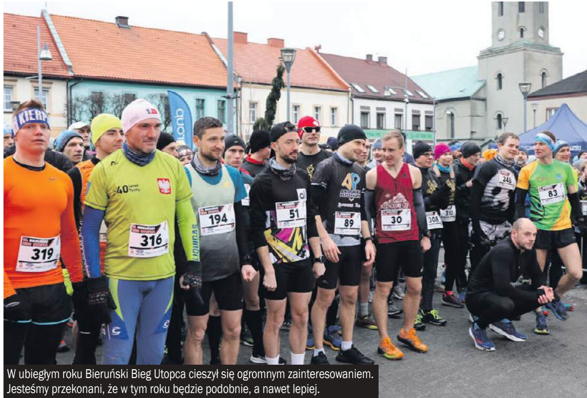
W ubiegłym roku Bieruński Bieg Utopca cieszył się ogromnym zainteresowaniem. Jesteśmy przekonani, że w tym roku będzie podobnie, a nawet lepiej.

Zbliża się finał Wielkiej Orkiestry Świątecznej Pomocy, a to oznacza, że uczestnicy Bieruńskiego Biegu „Utopca” już powinni szlifować formę.