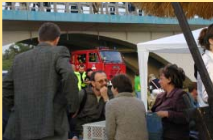
„Niezależna” prasa na garnuszku Porąbka