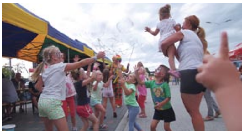
Najmłodszych uczestników festynu zabawiał klaun. Najbardziej cieszyły wielkie bańki mydlane i zwierzątka z balonów.