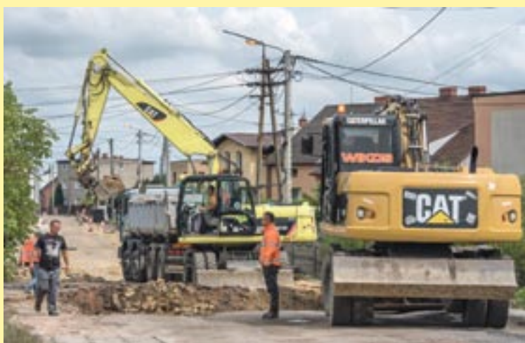
Na Łysinowej trwa przygotowanie pod budowę nowej drogi.

Praca wre także na ul. Marcina, w rejonie ul. Oświęcimskiej. Tam prowadzone są roboty rozbiórkowe, budowa odcinka kanalizacji deszczowej, budowa sieci teletechnicznej oraz wymiana wodociągu.