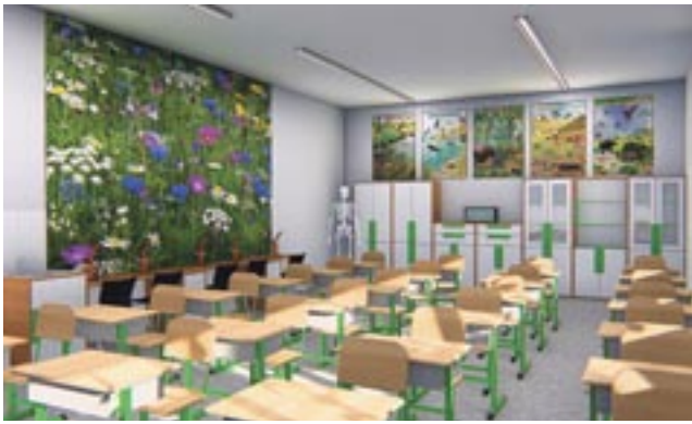
Szkoły gotowe na pierwszy dzwonek / str. 6