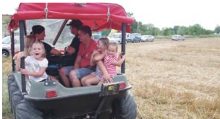
Długa kolejka ustawiła się do przejażdżek wszędołazem, zorganizowanych przez strażaków. Frajdę miały przede wszystkim dzieci.