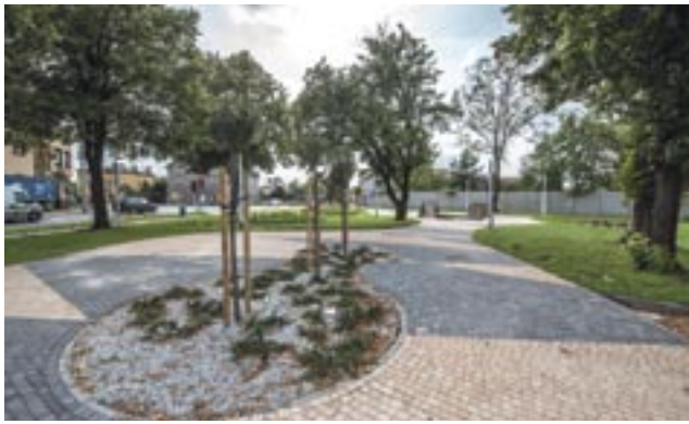
Budżet Obywatelski / str. 7