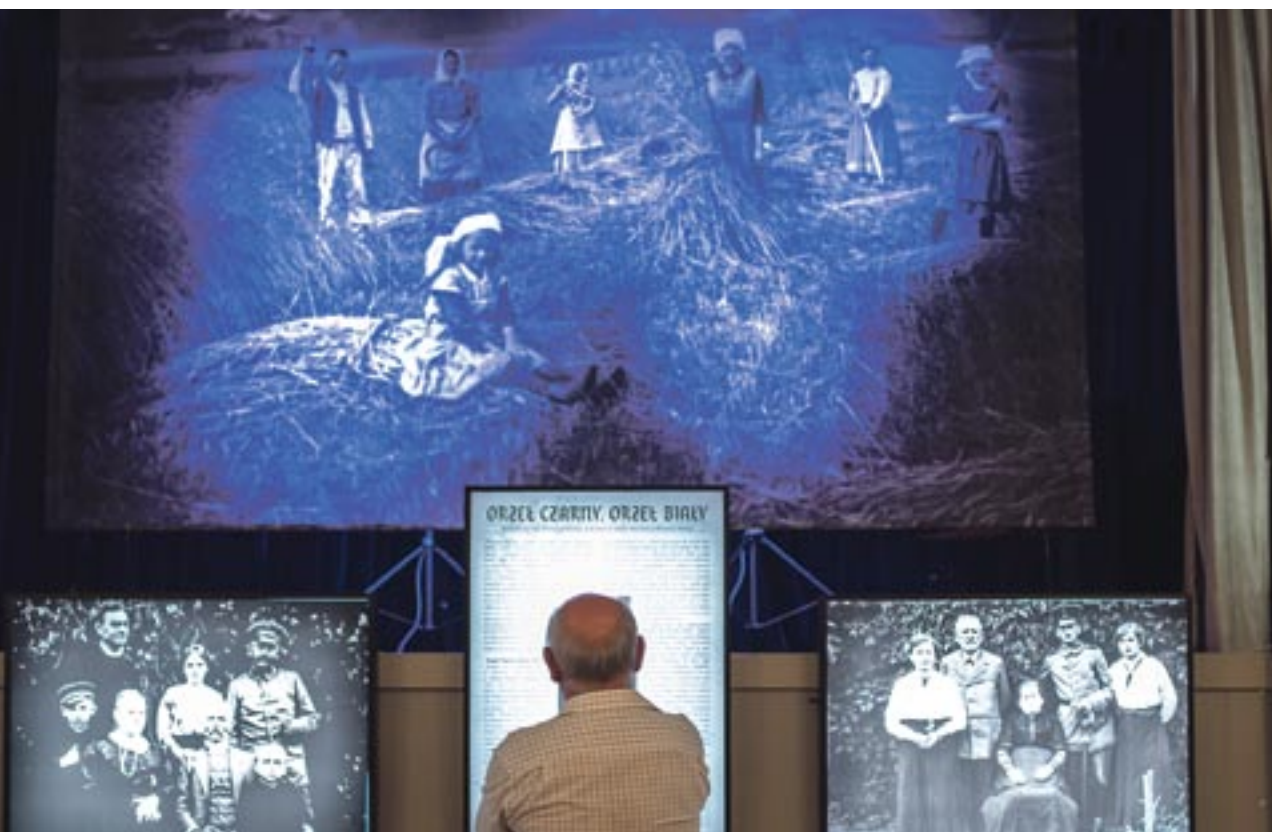
W centralnym punkcie ekspozycji zamieszczone jest zdjęcie przedstawiające wiejskie życie ludności.

Pomnik św. Walentego nie jest zabytkiem, lecz obiektem współczesnym (został ufundowany z okazji 600-lecia Bierunia). Po renowacji Święty Walenty może w pełnej okazałości nadal sprawować patronat nad miastem i cieszyć swym wizerunkiem mieszkańców oraz gości. oprac. SW