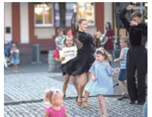
Reprezentacja Szkoły Tańca Wir w mig poderwała najmłodszych do wspólnej zabawy.