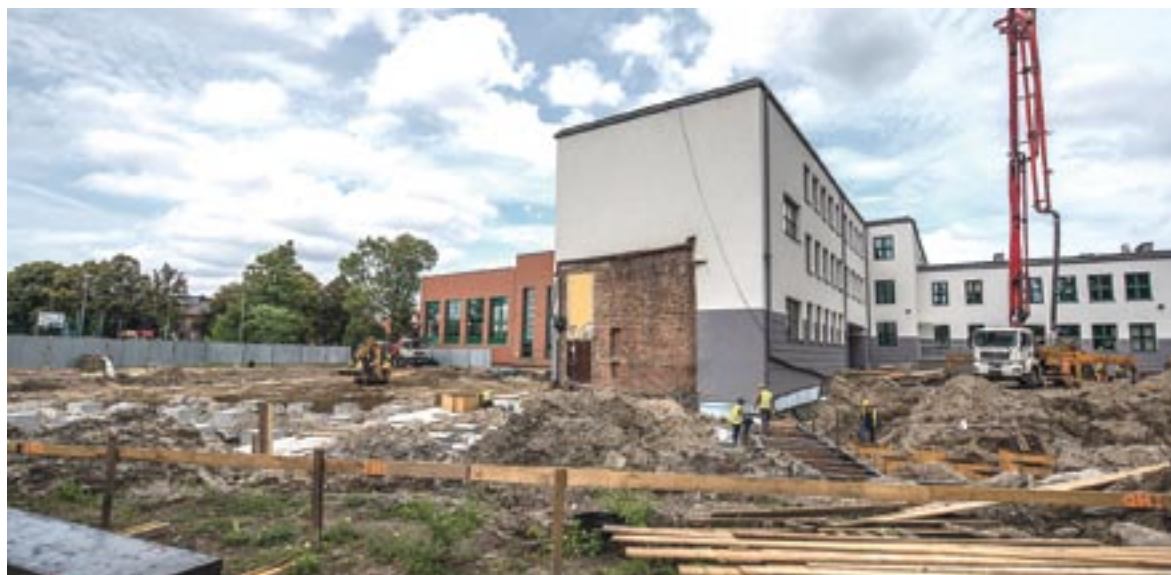
Trwa budowa nowej sali gimnastycznej. Uczniowie będą mogli śledzić jej postępy w trakcie roku szkolnego.