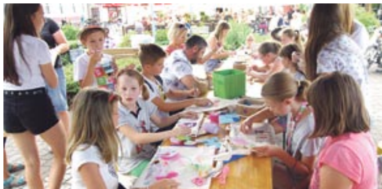
Warsztaty zdobienia toreb, zorganizowane przez Wolontariat pracowniczy HOPE z firmy Danone, cieszyły się ogromnym powodzeniem.