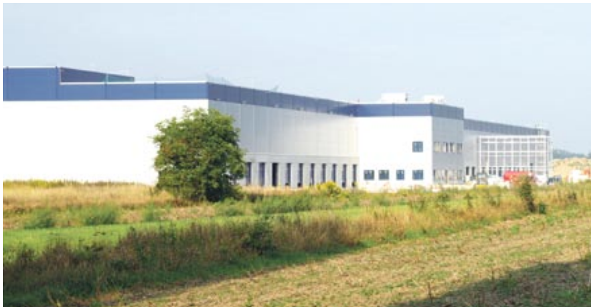
Część terenów wokół Bierunia ma status strefy ekonomicznej, jednak znaczenie stref zmalało po niedawnej zmianie przepisów.

Część terenów wokół Bierunia ma status strefy ekonomicznej, jednak teraz, po zmianie przepisów, nie ma to już w zasadzie większego znaczenia (specjalne zachęty finansowe dla inwe-