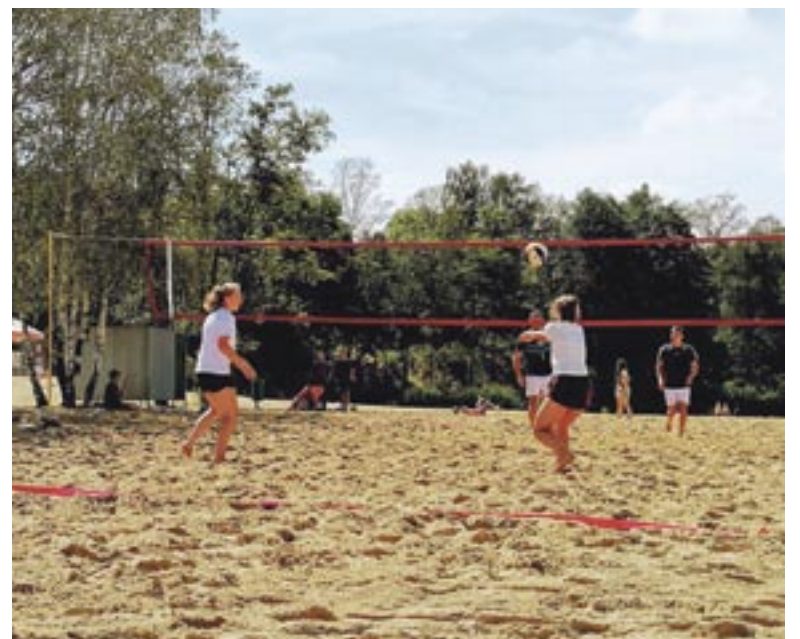
Turniej siatkówki plażowej wrócił na Łysinę.