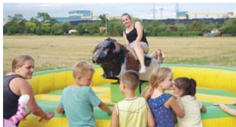
Byk rodeo – to jedna z atrakcji tegorocznego festynu. Chętnych by spróbować utrzymać się na jego grzbiecie było wielu.