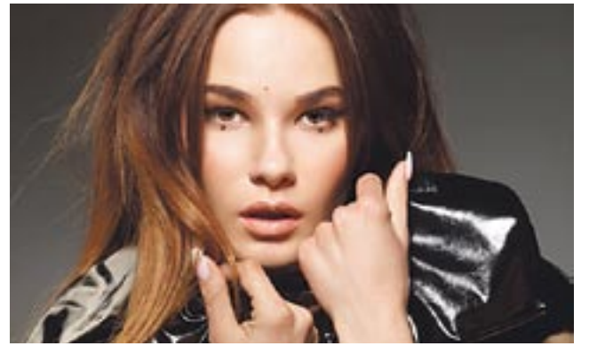
Dni Miasta i Dożynki / str. 13