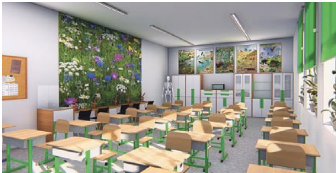
Wizualizacja „Zielonej pracowni” w SP nr 1.

Ten rok szkolny będzie z pewnością ciekawy dla nieco starszych uczniów i ich nauczycieli. Liceum Ogólnokształcące im. Powstańców Śląskich i Powiatowy Zespół Szkół w Bieruniu musiały się zmierzyć z naborem „podwójnego rocznika” czyli absolwentów trzecich klas gimnazjalnych i ósmych klas szkół podstawowych.