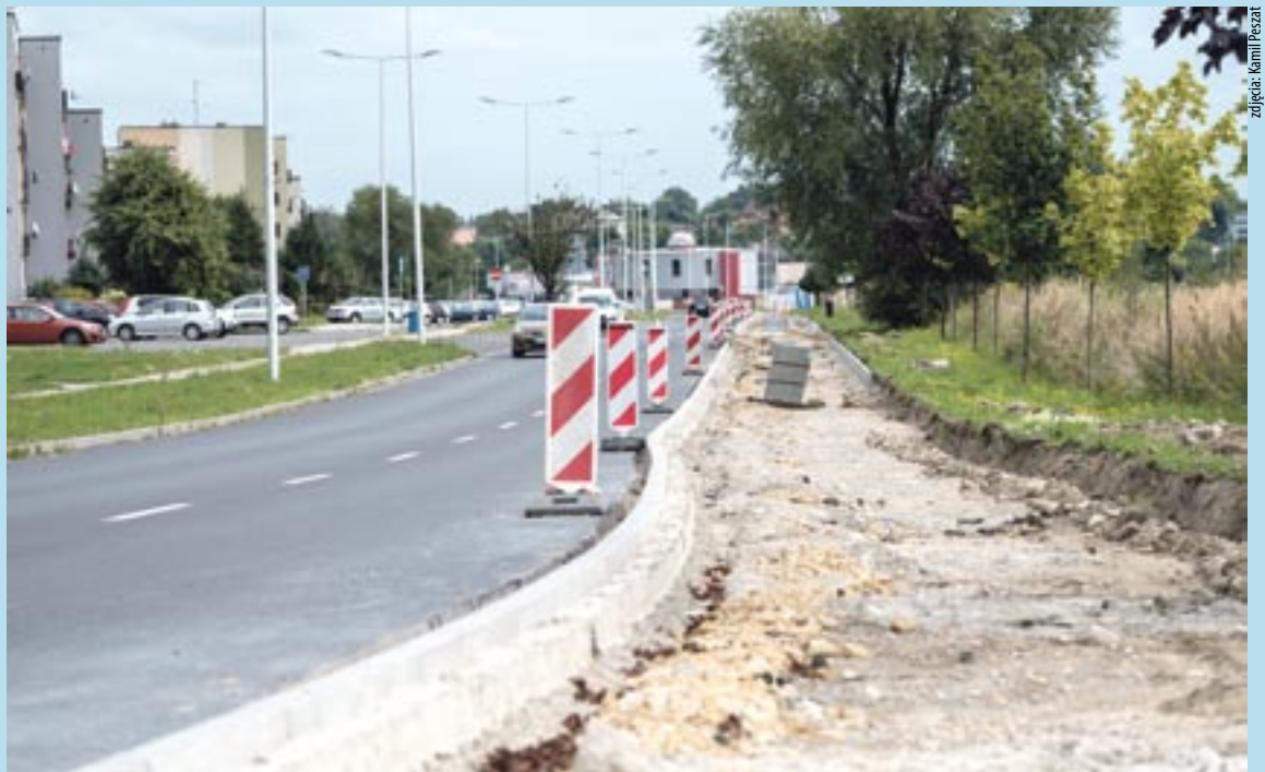
Prace przy budowie drogi dla rowerów wzdłuż ul. Węglowej

Za łączną kwotę ponad 26 tys. zł. powstały dwa wybrukowane stanowiska z ławkami, koszami na śmieci, i stojakami rowerowymi.