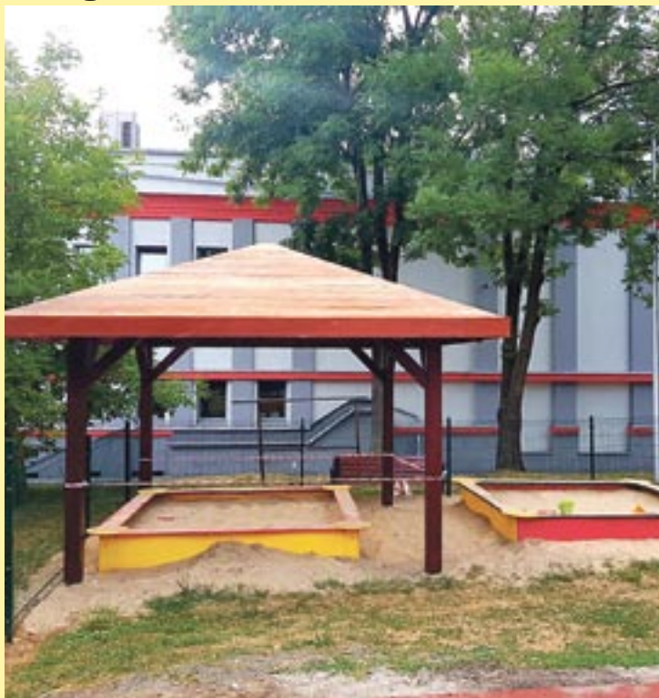
Wiaty osłoni przed palącym słońcem i przed deszczem.

Przy okazji realizacji tego zadania, Bieruński Ośrodek Sportu i Rekreacji, który był inwestorem, zlecił również instalację wiaty nad jedną z piaskownic. Tego typu zadanie chronić będzie najmłodszych mieszkańców zarówno przed słońcem, jak i przed deszczem. Dodajmy, że w obu piaskownicach wymieniony oczywiście został piasek.