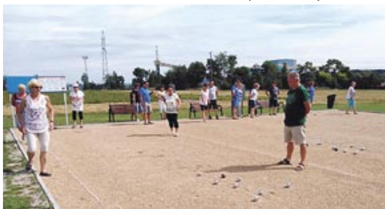
Festyn był w tym roku połączony z otwarciem boisk do gry w bule. Przy tej okazji rozegrano pierwszy turniej.