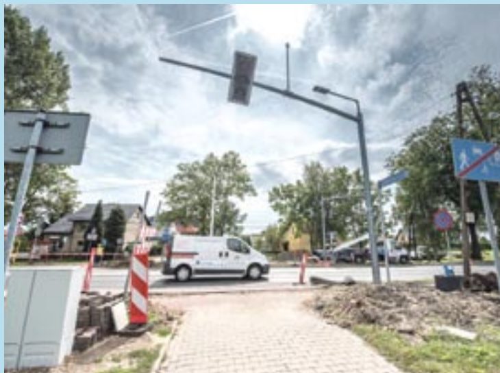
W tym miejscu już niedługo będzie można przejść bezpiecznie

Koszt zadania to 370 255 zł. Termin wykonania - 24 września br.