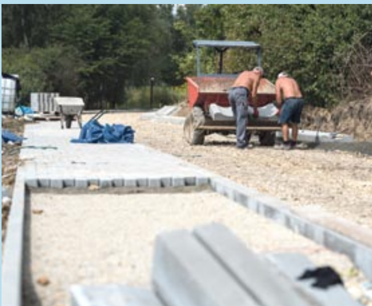
Ścieżka rowerowa po śladzie ul. Wylotowej niedługo będzie gotowa.