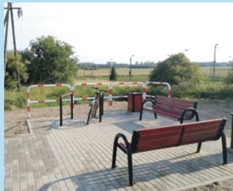
Takie miejsca do odpoczynku dla rowerzystów powstały na Plantach Karola