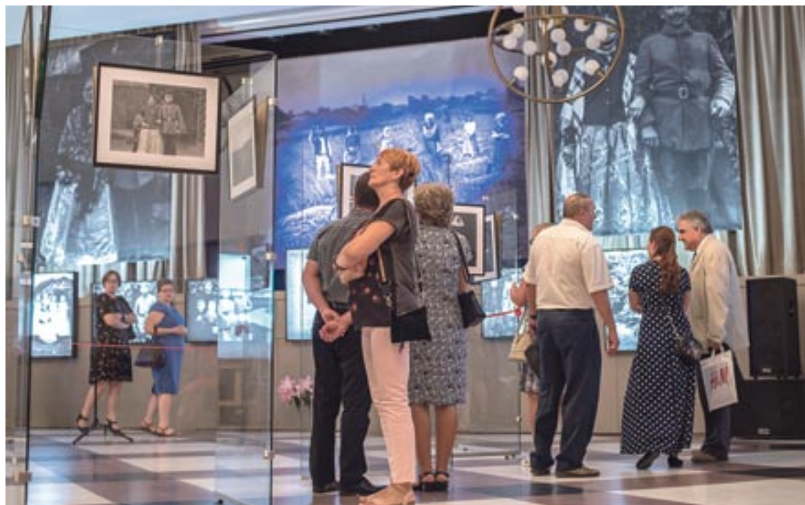
Odbijające się w przeszklonych powierzchniach postacie powodują wrażenie obcowania z duchami przeszłości. Świetny zabieg muzealników.