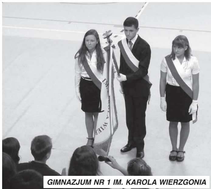
GIMNAZJUM NR 1 IM. KAROLA WIERZGONIA

W tym roku szkolnym jest sporo nowości. Rozpoczęła funkcjonowanie klasa matematyczno-informatyczna ze specjalnym rozszerzonym programem nauczania matematyki opartym o oprogramowanie komputerowe. Największą niespodzianką dla uczniów jest włączenie do programu zajęć wychowania fizycznego gry w kręgle w wymiarze 8 godzin rocznie. W ramach zajęć artystycznych uczniowie wybrali taniec współczesny i tradycyjny lub